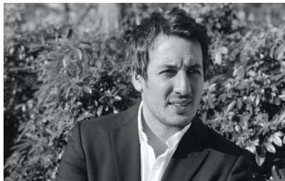
Rubin Derhy © D.R.